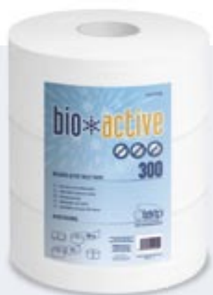
Papier Hygiénique Grands Rouleaux Bio-Active 300 Papel Higiénico Industrial Bio-Active 300