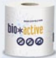
Papier Hygiénique Bio-Active 1 Papel Higiénico Bio-Active 1

Le papier toilette Bio-Active peut être utilisé n'importe où, que ce soit dans des «toilettes» permanentes ou temporaires (habitat de loisirs, salons et foires...), reliés ou non aux égouts.