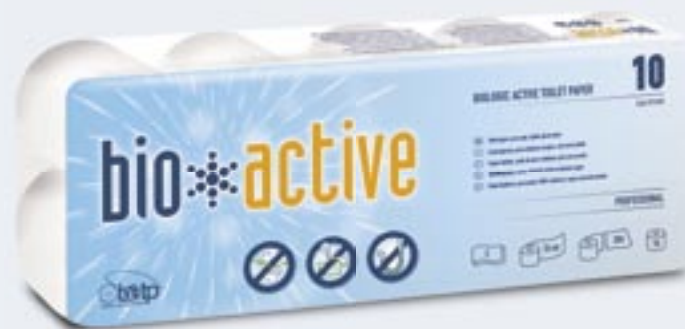
Papier Hygiénique Bio-Active 10 Papel Higiénico Bio-Active 10